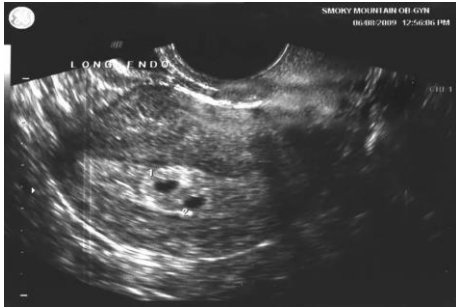
6 недель беременности