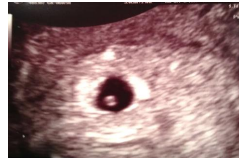
8 недель беременности